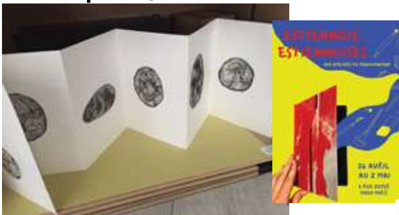
Projet pédagogique en cours section ébénisterie école Boule - plan galerie Ménéil'8 réalisé par les élèves - plan d'un meuble à l'étude.